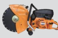
Disco de corte mecánico